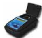
Medidor de turvação em líquidos