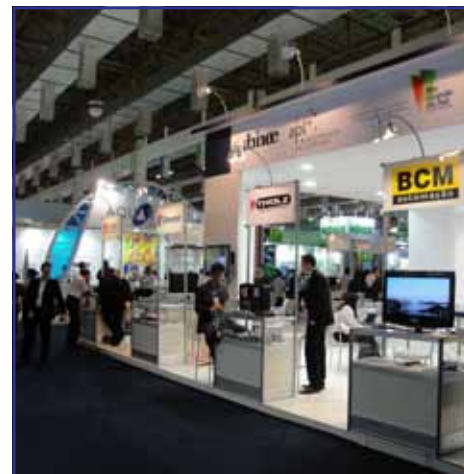
Abinee e Governo do Estado do RS (SDPI) apoiaram participação das empresas no estande coletivo