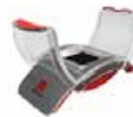
Leitor biométrico da palma da mão

A Victum se consolidou com sua atuação no mercado de nicho, que se caracteriza pelas particularidades e individualidades de cada produto que, em sua maioria, são comercializados com baixa e média escalas de produção. A empresa está capacitada a atender perfeitamente este segmento de mercado, com infra-estrutura que engloba toda a cadeia de desenvolvimento de produto, desde a etapa de projeto de design e engenharia à fabricação de moldes e injeção de peças plásticas. Desta forma disponibiliza gabinetes que realçam a identidade do produto e permitem utilizar todas as funcionalidades do plástico injetado. Os preços e prazos chegam a 1/3 das tradicionais soluções em moldes fabricados em aço.