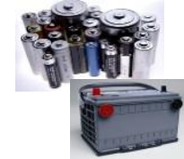
Pilhas e Baterias