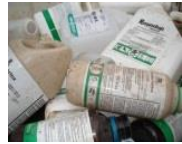
Agrotóxicos e suas Embalagens