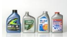
Óleos Lubrificantes e suas Embalagens