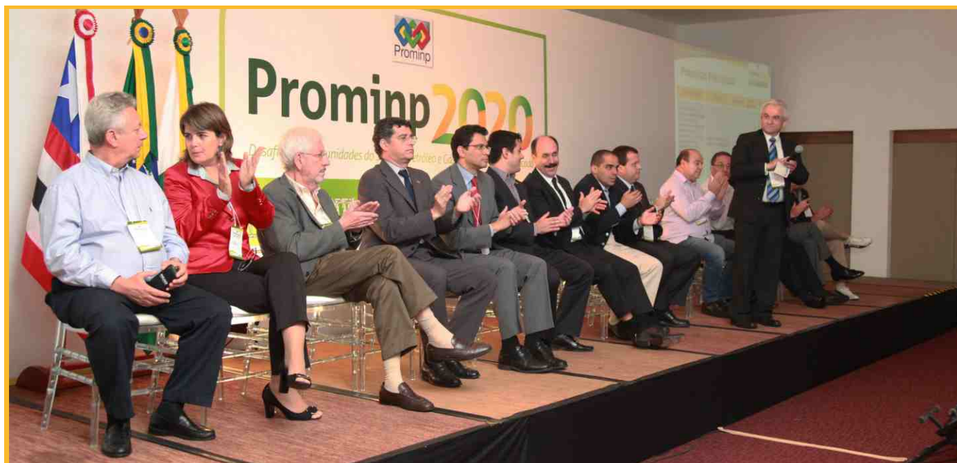
Representantes do Comitê Executivo do Prominp apresentam as propostas para o desenvolvimento da indústria nacional na próxima década.

Ao final do 8º Encontro Nacional do Prominp, representantes dos quatro painéis apresentaram as deliberações do Comitê Executivo sobre os temas propostos para o evento, como: a integração do Prominp com o Plano Brasil Maior; a aproximação academia-indústria; a estruturação de plano análogo ao PNQP (Plano Nacional de Qualificação Profissional) para fomentar o desenvolvimento tecnológico e a inovação industrial; a isonomia entre produtos nacionais e importados; a atração de empresas estrangeiras para produzir itens não fabricados no Brasil (especialmente na indústria naval); modelos de contratação que