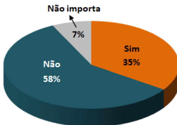
Empresas com dificuldades devido à operação padrão dos auditores fiscais nas alfândegas (percentual das empresas)

Entre os principais entraves destacou-se o atraso na liberação/fiscalização de cargas, citado por 31% das empresas.